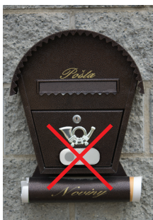
Kovová poštovní schránka