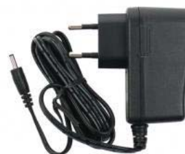
przewód UTP przewód RS232 mini USB przewód adapter AD05/JACK