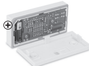
Obr. 4 Zavírání